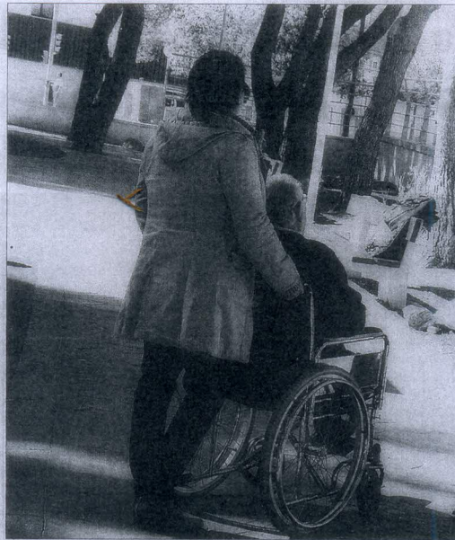
Imagen de archivo de una persona dependiente. JESUS CRUCES

Por contra, si que se oponen a que éstos realicen la valoración sanitaria de los dependientes, «pues todas las cuestiones relacionadas con la salud deben estar en manos de profesionales sanitarios». Las enfermeras, recuerdan estas entidades, «son los profesio-